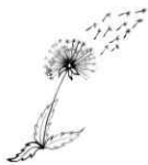
Rete Cooperazione Educativa